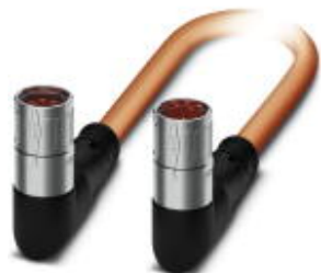
Штекерный разъем, пластиковая заливка с обеих сторон, длина: 10 м, цвет наружной оболочки: оранжевый RAL 2003

Обратите внимание на то, что приведенные здесь данные взяты из online-каталога. Полная информация и данные содержатся в документации пользователя. Действуют Общие условия использования для информации, загруженной из интернета. ( http://phoenixcontact.ru/download )