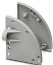
Крепежный фланец, для непосредственного монтажа на панель

Обратите внимание на то, что приведенные здесь данные взяты из online-каталога. Полная информация и данные содержатся в документации пользователя. Действуют Общие условия использования для информации, загруженной из интернета. ( http://phoenixcontact.ru/download )