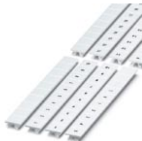
Маркировочная планка Zack, с символами вдоль полосы: L1, белый

Обратите внимание на то, что приведенные здесь данные взяты из online-каталога. Полная информация и данные содержатся в документации пользователя. Действуют Общие условия использования для информации, загруженной из интернета. ( http://phoenixcontact.ru/download )