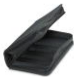
Футляр для инструмента, неукомплектован

Сумка для инструментов, не укомплектованная - TOOL-KIT STANDARD EMPTY - 1212423