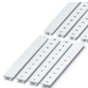
Маркировочная планка Zack, 10 элементов, с нанесенными вдоль полосы цифрами по порядку: 81 ... 90, белый

Обратите внимание на то, что приведенные здесь данные взяты из online-каталога. Полная информация и данные содержатся в документации пользователя. Действуют Общие условия использования для информации, загруженной из интернета. ( http://phoenixcontact.ru/download )