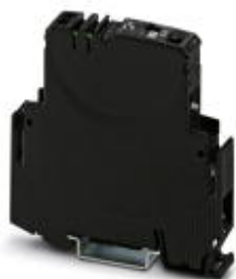
Электронный автоматический защитный выключатель, контакт сигнальной цепи: 1 замыкающий контакт, номинальный ток: 6 А

Обратите внимание на то, что приведенные здесь данные взяты из online-каталога. Полная информация и данные содержатся в документации пользователя. Действуют Общие условия использования для информации, загруженной из интернета. ( http://phoenixcontact.ru/download )