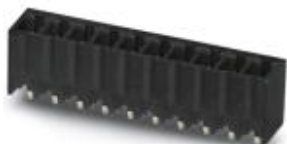
На рисунке показан 10-контактный вариант изделия

Корпусная часть для печатных плат, номинальный ток: 8 А, расчетное напряжение (III/2): 160 В, полюсов: 8, размер шага: 3,81 мм, цвет: черный, поверхность контакта: олово, монтаж: THR пайка, Информация для пользователя и рекомендации по проектированию процесса технологии сквозного печатного монтажа находится в разделе загрузок