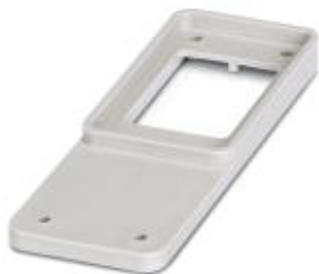
Соединительная плата HEAVYCON, тип B24 и B6, для вырезов в перегородке типа B24, цвет серый

Обратите внимание на то, что приведенные здесь данные взяты из online-каталога. Полная информация и данные содержатся в документации пользователя. Действуют Общие условия использования для информации, загруженной из интернета. ( http://phoenixcontact.ru/download )