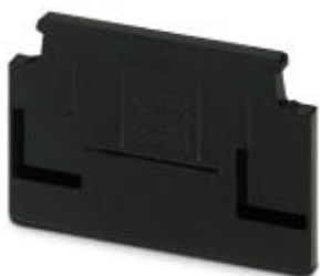
Концевая крышка, длина: 59 мм, ширина: 3,5 мм, высота: 37,7 мм, цвет: черный

Обратите внимание на то, что приведенные здесь данные взяты из online-каталога. Полная информация и данные содержатся в документации пользователя. Действуют Общие условия использования для информации, загруженной из интернета. ( http://phoenixcontact.ru/download )