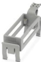
Монтажные рамы разъемов HEAVYCON, для контактных вставок типа B24

Обратите внимание на то, что приведенные здесь данные взяты из online-каталога. Полная информация и данные содержатся в документации пользователя. Действуют Общие условия использования для информации, загруженной из интернета. ( http://phoenixcontact.ru/download )