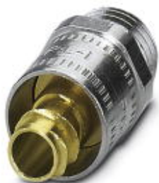
Резьбовое соединение кабеля из латуни с резьбой Pg, поворотное, класс защиты IP40

Обратите внимание на то, что приведенные здесь данные взяты из online-каталога. Полная информация и данные содержатся в документации пользователя. Действуют Общие условия использования для информации, загруженной из интернета. ( http://phoenixcontact.ru/download )