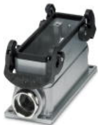
Приборный корпус с двумя защелками, высота 67 мм, с резьбовым соединением, 2x Pg21

Обратите внимание на то, что приведенные здесь данные взяты из online-каталога. Полная информация и данные содержатся в документации пользователя. Действуют Общие условия использования для информации, загруженной из интернета. ( http://phoenixcontact.ru/download )