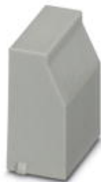
Заглушки, для неиспользуемых клемм

Обратите внимание на то, что приведенные здесь данные взяты из online-каталога. Полная информация и данные содержатся в документации пользователя. Действуют Общие условия использования для информации, загруженной из интернета. ( http://phoenixcontact.ru/download )