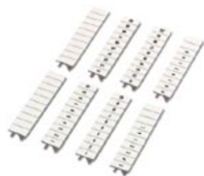
Маркировочная планка Zack, 10 элементов, с надписями поперек полосы, цифры по порядку: 201 ... 210, белый, ширина: 5 мм

Обратите внимания на то, что приведенные здесь данные взяты из online-каталога. Полная информация и данные содержатся в документации пользователя. Действуют Общие условия использования для информации, загруженной из интернета. ( http://phoenixcontact.ru/download )