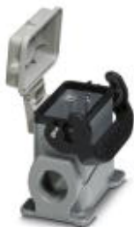
Приборный корпус HEAVYCON B10, с одной защелкой, высота 74 мм, с опорой 1 x M25, с крышкой

Обратите внимание на то, что приведенные здесь данные взяты из online-каталога. Полная информация и данные содержатся в документации пользователя. Действуют Общие условия использования для информации, загруженной из интернета. ( http://phoenixcontact.ru/download )