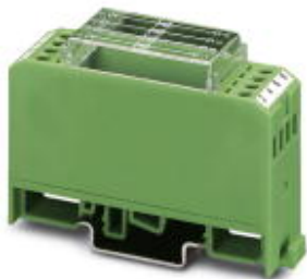
Диодная сборка, 4 диода с отдельными выводами, тип диодов 1N 4007

Обратите внимание на то, что приведенные здесь данные взяты из online-каталога. Полная информация и данные содержатся в документации пользователя. Действуют Общие условия использования для информации, загруженной из интернета. ( http://phoenixcontact.ru/download )