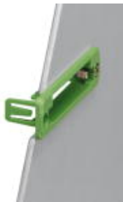
Принадлежности, полюсов: 4, размер шага: 5,08 мм, цвет: зеленый

Обратите внимание на то, что приведенные здесь данные взяты из online-каталога. Полная информация и данные содержатся в документации пользователя. Действуют Общие условия использования для информации, загруженной из интернета. ( http://phoenixcontact.ru/download )