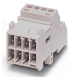
Модуль контактных вставок, для монтажных рам, с винтовыми зажимами, 7 полюсов + контакт PE, 160 В / 10 А

Обратите внимание на то, что приведенные здесь данные взяты из online-каталога. Полная информация и данные содержатся в документации пользователя. Действуют Общие условия использования для информации, загруженной из интернета. ( http://phoenixcontact.ru/download )