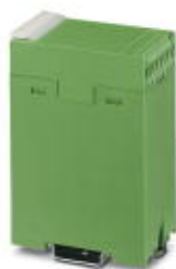
Нижняя часть корпуса с металлической защелкой и контрольными гнездами с боковыми крышками

Обратите внимание на то, что приведенные здесь данные взяты из online-каталога. Полная информация и данные содержатся в документации пользователя. Действуют Общие условия использования для информации, загруженной из интернета. ( http://phoenixcontact.ru/download )