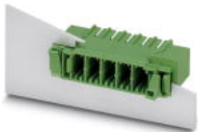
На рисунке показан 5-контактный вариант изделия

Обратите внимание на то, что приведенные здесь данные взяты из online-каталога. Полная информация и данные содержатся в документации пользователя. Действуют Общие условия использования для информации, загруженной из интернета. ( http://phoenixcontact.ru/download )