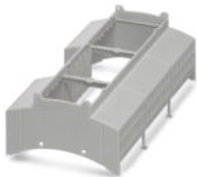
Установочные корпуса, Верхняя часть корпуса, ширина: 161,6 мм

Обратите внимание на то, что приведенные здесь данные взяты из online-каталога. Полная информация и данные содержатся в документации пользователя. Действуют Общие условия использования для информации, загруженной из интернета. ( http://phoenixcontact.ru/download )