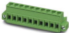
На рисунке показан 10-контактный вариант изделия

Разъемы для печатной платы, номинальный ток: 12 А, расчетное напряжение (III/2): 320 В, полюсов: 20, размер шага: 5,08 мм, тип подключения: Винтовой зажим с натяжной гильзой, цвет: зеленый, поверхность контакта: олово