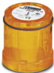
Элемент светодиодной импульсной лампы, 24 В DC, двойная вспышка, желтый

Обратите внимание на то, что приведенные здесь данные взяты из online-каталога. Полная информация и данные содержатся в документации пользователя. Действуют Общие условия использования для информации, загруженной из интернета. ( http://phoenixcontact.ru/download )