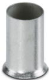
Кабельный наконечник, длина: 12 мм, цвет: серебристый

Обратите внимание на то, что приведенные здесь данные взяты из online-каталога. Полная информация и данные содержатся в документации пользователя. Действуют Общие условия использования для информации, загруженной из интернета. ( http://phoenixcontact.ru/download )