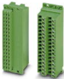
Соединительная колодка 19", полюсов: 32, размер шага: 0 мм, цвет: зеленый

Обратите внимание на то, что приведенные здесь данные взяты из online-каталога. Полная информация и данные содержатся в документации пользователя. Действуют Общие условия использования для информации, загруженной из интернета. ( http://phoenixcontact.ru/download )