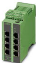
Управляемый коммутатор Ethernet Lean с восемью портами RJ45 на 10/100 Мбит/с

Обратите внимание на то, что приведенные здесь данные взяты из online-каталога. Полная информация и данные содержатся в документации пользователя. Действуют Общие условия использования для информации, загруженной из интернета. ( http://phoenixcontact.ru/download )