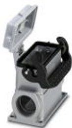
Приборный корпус HEAVYCON B16, с одной защелкой, высота 67 мм, с опорой 1 x M25 и крышкой

Обратите внимание на то, что приведенные здесь данные взяты из online-каталога. Полная информация и данные содержатся в документации пользователя. Действуют Общие условия использования для информации, загруженной из интернета. ( http://phoenixcontact.ru/download )