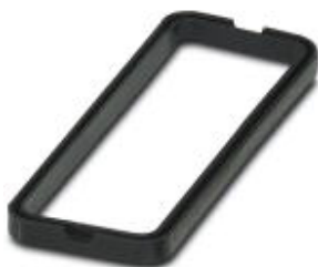
Запасное профилированное уплотнение, для корпусов HC-EVO-D25.....BK

Обратите внимание на то, что приведенные здесь данные взяты из online-каталога. Полная информация и данные содержатся в документации пользователя. Действуют Общие условия использования для информации, загруженной из интернета. ( http://phoenixcontact.ru/download )