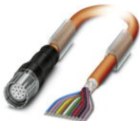
Кабельный штекер, пластиковая заливка, длина: 10 м, цвет наружной оболочки: оранжевый RAL 2003

Обратите внимание на то, что приведенные здесь данные взяты из online-каталога. Полная информация и данные содержатся в документации пользователя. Действуют Общие условия использования для информации, загруженной из интернета. ( http://phoenixcontact.ru/download )