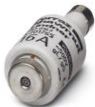
Плавкая вставка, номинальный ток: 16 А, длина: 50 мм, диаметр: 22 мм, цвет: серый

Обратите внимание на то, что приведенные здесь данные взяты из online-каталога. Полная информация и данные содержатся в документации пользователя. Действуют Общие условия использования для информации, загруженной из интернета. ( http://phoenixcontact.ru/download )