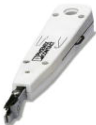
Инструмент для подсоединения проводников к колодкам LSA-Plus

Обратите внимание на то, что приведенные здесь данные взяты из online-каталога. Полная информация и данные содержатся в документации пользователя. Действуют Общие условия использования для информации, загруженной из интернета. ( http://phoenixcontact.ru/download )