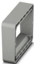
Проставка для проходных клемм PLW 16-6/4

Обратите внимание на то, что приведенные здесь данные взяты из online-каталога. Полная информация и данные содержатся в документации пользователя. Действуют Общие условия использования для информации, загруженной из интернета. ( http://phoenixcontact.ru/download )