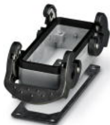
Монтажный корпус HEAVYCON B16, с поперечной защелкой, высота 29 мм, с плоским уплотнением

Обратите внимание на то, что приведенные здесь данные взяты из online-каталога. Полная информация и данные содержатся в документации пользователя. Действуют Общие условия использования для информации, загруженной из интернета. ( http://phoenixcontact.ru/download )