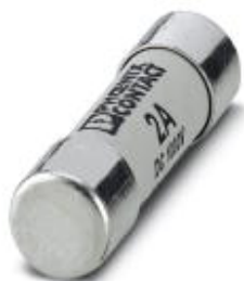
Предохранитель, 10,3x38 мм, напряжение постоянного тока до 1000 В, gPV

Обратите внимание на то, что приведенные здесь данные взяты из online-каталога. Полная информация и данные содержатся в документации пользователя. Действуют Общие условия использования для информации, загруженной из интернета. ( http://phoenixcontact.ru/download )