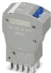
Термомагнитный защитный выключатель, 2-полюсный, характеристика срабатывания M1 (полуинертного типа), 2 переключающих контакта, штекер для базового элемента

Обратите внимание на то, что приведенные здесь данные взяты из online-каталога. Полная информация и данные содержатся в документации пользователя. Действуют Общие условия использования для информации, загруженной из интернета. ( http://phoenixcontact.ru/download )