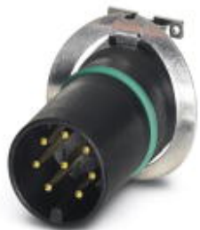
Комплект образцов, 8-полюсн., Штекеры, прямое, M12, A - стандарт, Монтаж на печатную плату, SMD

Обратите внимание на то, что приведенные здесь данные взяты из online-каталога. Полная информация и данные содержатся в документации пользователя. Действуют Общие условия использования для информации, загруженной из интернета. ( http://phoenixcontact.ru/download )