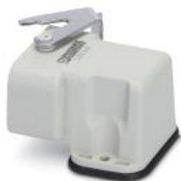
Монтажный корпус, с одной защелкой, угловое исполнение

Обратите внимание на то, что приведенные здесь данные взяты из online-каталога. Полная информация и данные содержатся в документации пользователя. Действуют Общие условия использования для информации, загруженной из интернета. ( http://phoenixcontact.ru/download )