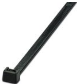
Кабельная стяжка, стандартная версия, для быстрого и надежного соединения

Обратите внимание на то, что приведенные здесь данные взяты из online-каталога. Полная информация и данные содержатся в документации пользователя. Действуют Общие условия использования для информации, загруженной из интернета. ( http://phoenixcontact.ru/download )