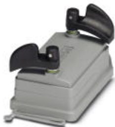
Защитная крышка HEAVYCON ADVANCE IP65 B10, с байонетным зажимом и шнуром, диаметр кольца 3 мм

Обратите внимание на то, что приведенные здесь данные взяты из online-каталога. Полная информация и данные содержатся в документации пользователя. Действуют Общие условия использования для информации, загруженной из интернета. ( http://phoenixcontact.ru/download )