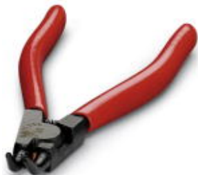
Инструмент для демонтажа держателей контактов HC-M-EMV

Обратите внимание на то, что приведенные здесь данные взяты из online-каталога. Полная информация и данные содержатся в документации пользователя. Действуют Общие условия использования для информации, загруженной из интернета. ( http://phoenixcontact.ru/download )