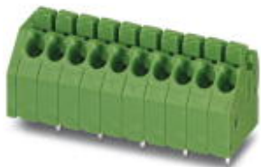
На рисунке показан 10-контактный вариант изделия

Обратите внимание на то, что приведенные здесь данные взяты из online-каталога. Полная информация и данные содержатся в документации пользователя. Действуют Общие условия использования для информации, загруженной из интернета. ( http://phoenixcontact.ru/download )