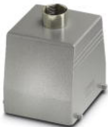
Сальниковый корпус HEAVYCON B32, крепление двумя защелками, высота 80 мм, с опорой 1x M25, прямое подключение кабеля

Обратите внимание на то, что приведенные здесь данные взяты из online-каталога. Полная информация и данные содержатся в документации пользователя. Действуют Общие условия использования для информации, загруженной из интернета. ( http://phoenixcontact.ru/download )