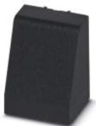
Установочный корпус, Верхняя часть корпуса, цвет: черный, ширина: 17,5 мм

Обратите внимание на то, что приведенные здесь данные взяты из online-каталога. Полная информация и данные содержатся в документации пользователя. Действуют Общие условия использования для информации, загруженной из интернета. ( http://phoenixcontact.ru/download )