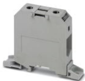
для прямого монтажа

Обратите внимание на то, что приведенные здесь данные взяты из online-каталога. Полная информация и данные содержатся в документации пользователя. Действуют Общие условия использования для информации, загруженной из интернета. ( http://phoenixcontact.ru/download )