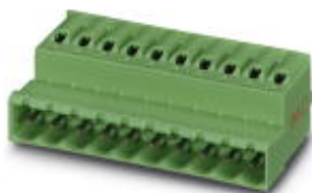
На рисунке показан 10-контактный вариант изделия

Разъемы для печатной платы, номинальный ток: 16 А, расчетное напряжение (III/2): 320 В, полюсов: 2, размер шага: 5,08 мм, тип подключения: Пружинные зажимы Push-in, цвет: зеленый, поверхность контакта: олово