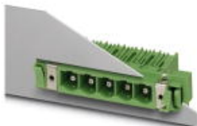
На рисунке показан 5-контактный вариант изделия

Компоненты для проходного монтажа, номинальный ток: 76 А, расчетное напряжение (III/2): 1000 В, полюсов: 8, размер шага: 10,16 мм, цвет: зеленый, поверхность контакта: Серебро, монтаж: Пайка волной припоя