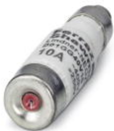
Плавкая вставка, номинальный ток: 10 А, длина: 36 мм, диаметр: 11 мм, цвет: красный

Обратите внимание на то, что приведенные здесь данные взяты из online-каталога. Полная информация и данные содержатся в документации пользователя. Действуют Общие условия использования для информации, загруженной из интернета. ( http://phoenixcontact.ru/download )