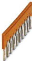
Перемычка, размер шага: 8,2 мм, ширина: 80,3 мм, полюсов: 10, цвет: оранжевый

Обратите внимание на то, что приведенные здесь данные взяты из online-каталога. Полная информация и данные содержатся в документации пользователя. Действуют Общие условия использования для информации, загруженной из интернета. ( http://phoenixcontact.ru/download )