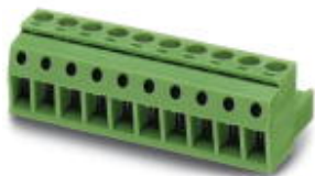
На рисунке показан 10-контактный вариант изделия

Разъемы для печатной платы, номинальный ток: 12 А, расчетное напряжение (III/2): 320 В, полюсов: 18, размер шага: 5 мм, тип подключения: Винтовой зажим с натяжной гильзой, цвет: зеленый, поверхность контакта: олово