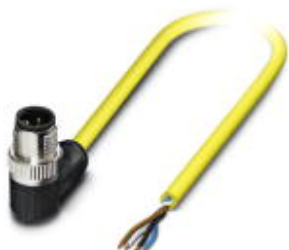
Кабель для датчика / исполнительного элемента, 4-полюсн., ПВХ, желтый, Штекеры угловой M12 SPEEDCON, A-кодирование, к свободный конец, длина кабеля: 10 м

Обратите внимание на то, что приведенные здесь данные взяты из online-каталога. Полная информация и данные содержатся в документации пользователя. Действуют Общие условия использования для информации, загруженной из интернета. ( http://phoenixcontact.ru/download )